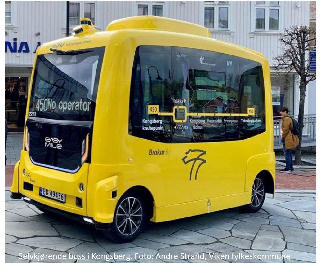
Selvkjørende buss i Kongsberg.